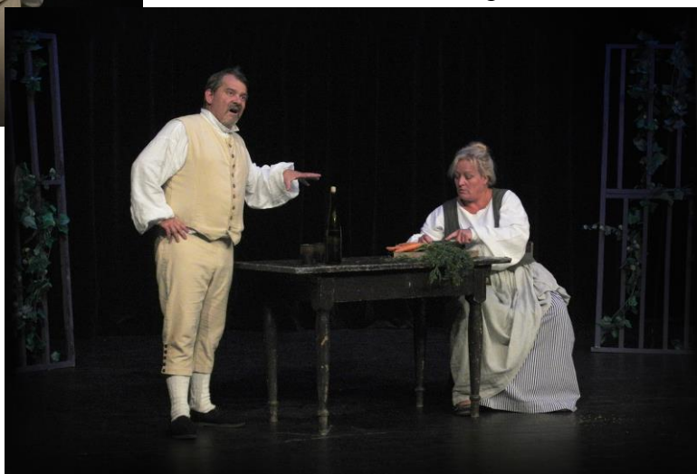
DS Vltavan z Týnu nad Vltavou s hrou „Generálka císaře Napoleona“